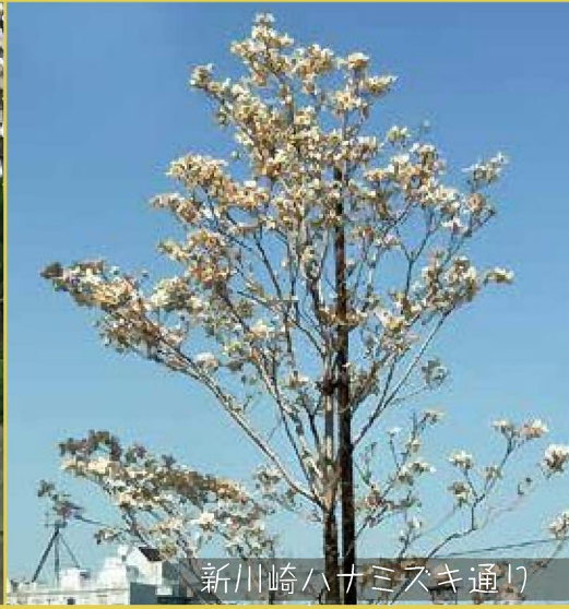
新川崎ハナミズキ通り