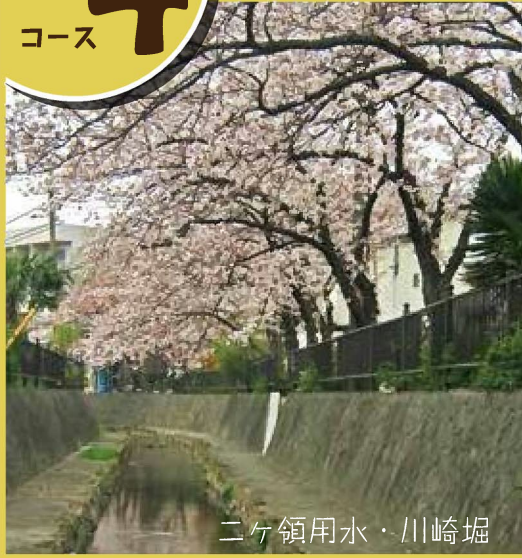
ニヶ領用水・川崎堀