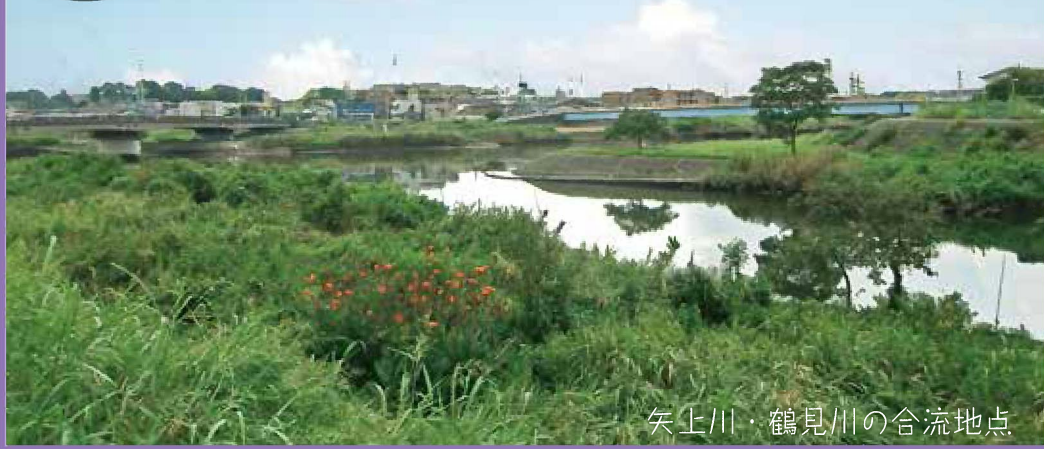
矢上川・鶴見川の合流地点